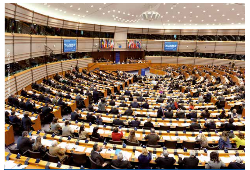
Das EU-Parlament ist der Überzeugung, dass CSR nicht zu einem Marketinginstrument verkümmern darf.