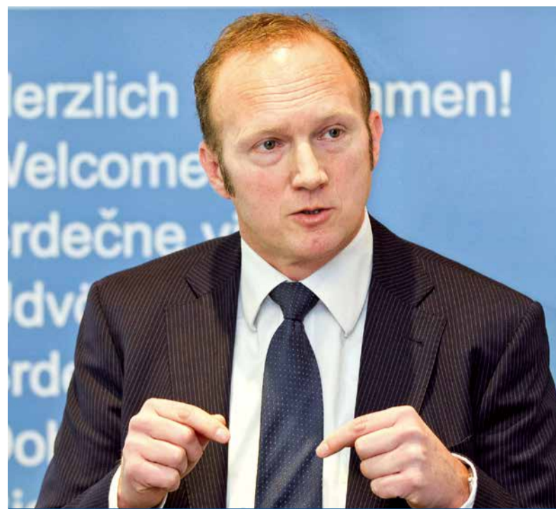
„Erst sind die Institutionellen wieder eingestiegen, jetzt entdecken Privatanleger die Fonds neu.“