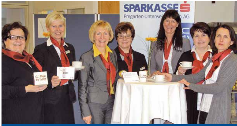
„Coffee to help“ in der Sparkasse Pregarten-Unterweißenbach.

Dabei ist es so einfach, diesen Kindern das zu geben, was sie jetzt am dringendsten brauchen: einen Platz in einem Waisenhaus, liebevolle Betreuung in einem Straßenkinderzentrum sowie ausreichend zu essen. Mit 30 Euro schenkt man einem Not leidenden Kind einen