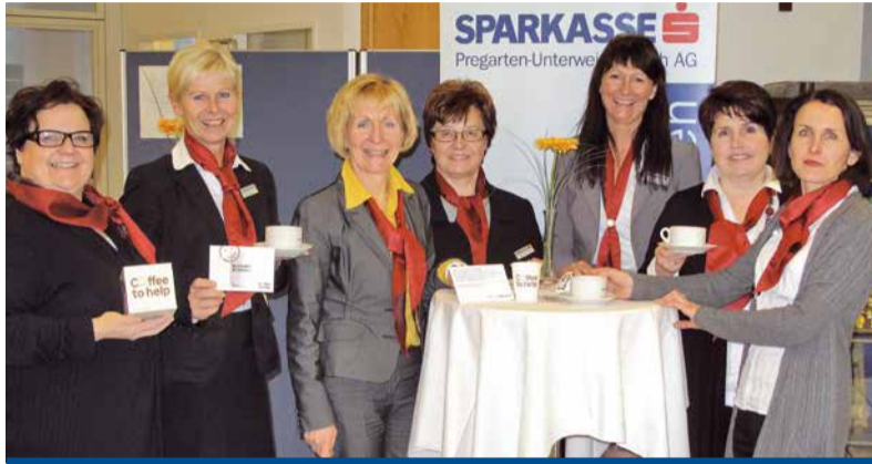
„Coffee to help“ in der Sparkasse Pregarten-Unterweissenbach.

Dabei ist es so einfach, diesen Kindern das zu geben, was sie jetzt am dringendsten brauchen: einen Platz in einem Waisenhaus, liebevolle Betreuung in einem Straßenkinderzentrum sowie ausreichend zu essen. Mit 30 Euro schenkt man einem Not leidenden Kind einen