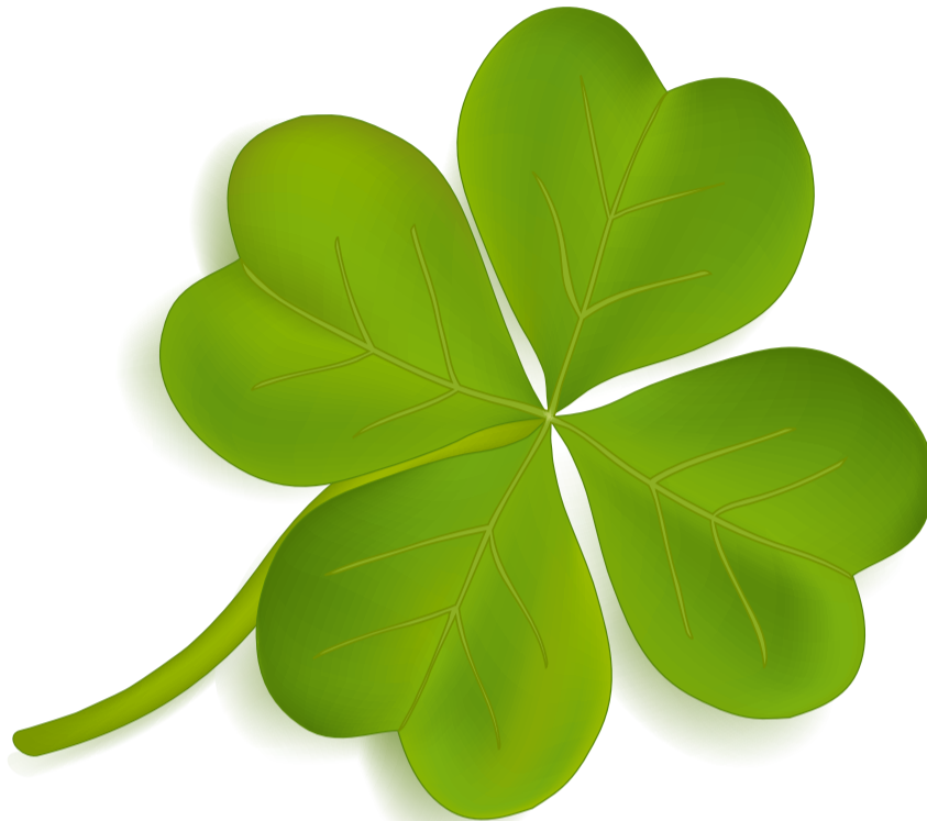
Eigeninteresse, politischer und gesellschaftlicher Druck, Rechtsvorschriften sowie Sanktionen bei Nichterfüllung stellen die vier Teile des „CSR-Kleeblatts“ dar, die die Basis für den Wiederaufschwung bilden sollen.

Das EU-Parlament ist der Überzeugung, dass CSR nicht zu einem Marketinginstrument verkümmern darf. CSR muss in der unternehmerischen Gesamtstrategie wie auch im Alltagsgeschäft eines Unternehmens fest verankert sein. Die Vorschläge des Europäischen Parlaments lassen sich am besten anhand eines „CSR-Kleeblatts“ darstellen, durch das Unternehmen angehalten werden sollen, diese von der Union erwünschte CSR-Integration